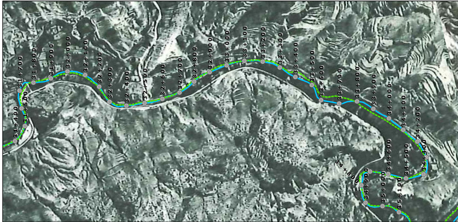
Ortofoto año 1956